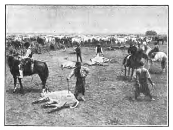
Marcándose el Ganado en Argentina

El Congreso nacional, que consiste en la Cámara de Senadores y la Cámara de Diputados, ejerce el poder legislativo. Las provincias se gobiernan por sí solas.